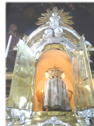
Igreja de S. José; Munique

NÃO FALTARÁ A EUCARISTIA porque Deus terá preparado os sacerdotes para irem de um lugar a outro. Haverá também um sacerdote servindo cada refúgio, e quando ele não estiver presente, o anjo levará a Santa Hóstia para as pessoas receberem a Comunhão.